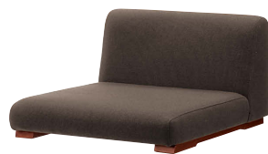
張地：布・NC・NC-014 (D) ¥33,000